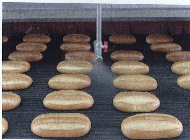
Batony z pekárny v Revdě, kde pracuje cyklotermická modulární pec ze Znojma, jsou jako ze zlata.

O Rusech se říká: když jedí, tak drží v jedné ruce vidličku a v druhé mají chléb. I proto je Rusko pro SSZN perspektivní trh. Výraznou jihomoravskou pečť nese také pekárna ve městě Revda.