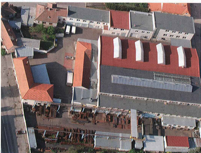
Sklářské stroje - Závod 1

stabilně práci 150 stálým zaměstnancům. Hlavním produktem znojenské společnosti zůstávají stroje a technologická zařízení pro linky na obalové sklo a zákazková strojírenská výroba. „Pekařské pece tvoří asi deset procent naší výroby a s nárůstem zakázek pro pekařství můžeme výrobní kapacitu bez problémů navýšit,“ prozradil Jiří Jaskula.“