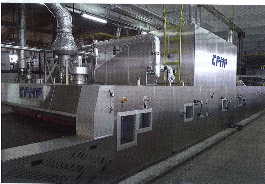
Podobá se trochu ponorce, ale místo torpéd z ní vyjždí pečivo. CPMP ze Sklářských strojů Znojmo stojí už v několika evropských pekárnách.