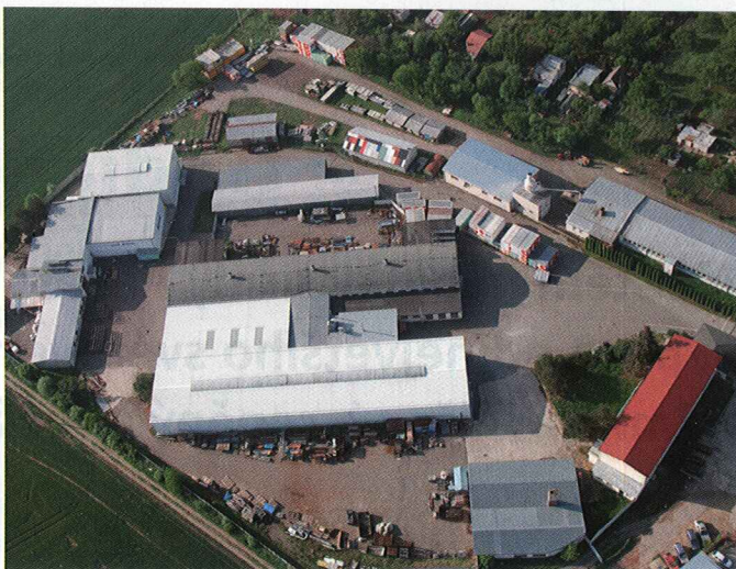
Sklářské stroje - Závod 2

K dalším přednostem znojenské CPMP patří vysoce jakostní a snadno vyměnitelný hořák, dlouhá životnost, jednoduchá a rychlá instalace. Kompletní montáž velké pece netrvá déle než dva týdny.