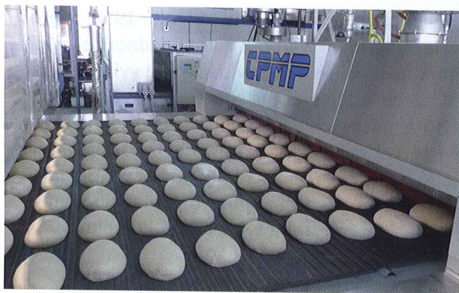
Výroba chleba – pekárna Revda, Ruská federace

O Rusech se říká: když jedí, tak drží v jedné ruce vidličku a v druhé mají chléb. I proto je Rusko pro SSZN perspektivní trh. Výraznou jihomoravskou pečť nese také pekárna ve městě Revda.